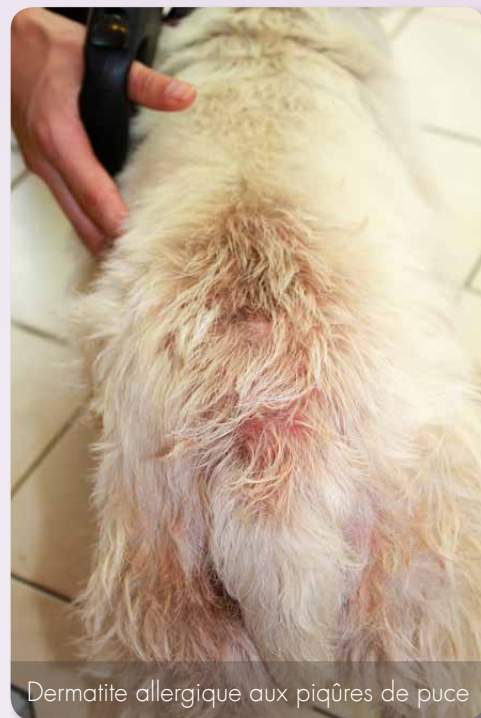
Dermatite allergique aux piqûres de puce

C'est de loin l'affection la plus rencontrée